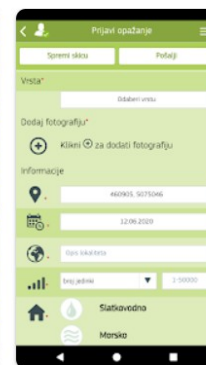
Slika: Pregled aplikacije